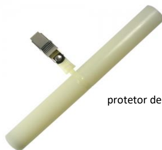
protetor de tubos