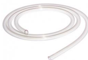
manguera de Tygon