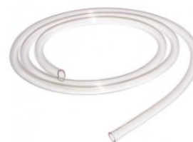
mangueira de Tygon