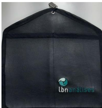
Bolsa para miniimpinger