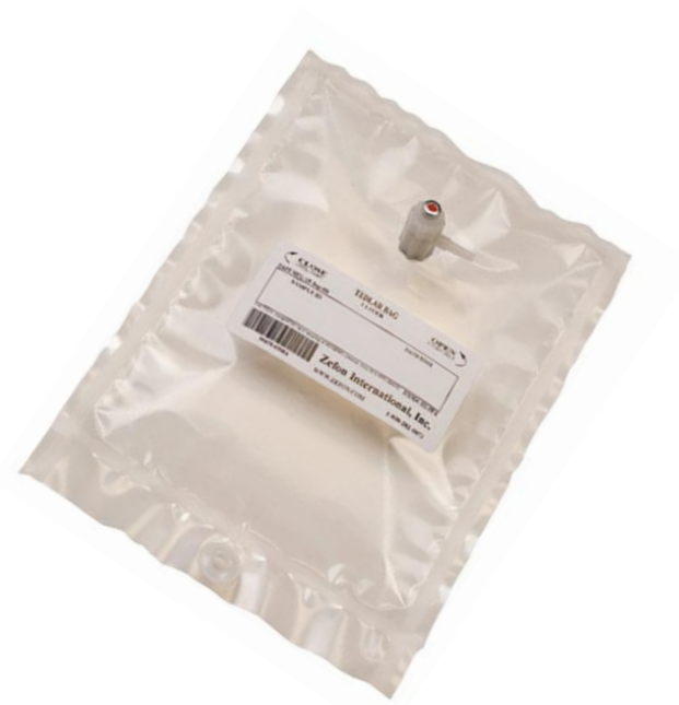
Amostrador tipo balão Tedlar ou Aluminizado (Multicamadas)